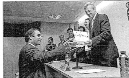
Arriba, personas que recogieron ayer la habilitación posan con el conselleiro. Abajo, Rueda entrega un título a uno de los aprobados.

que se incrementó en casi 115 horas la carga práctica en cursos y asignaturas de operativa policial, en las que se abordan cuestiones como defensa, tráfico o atestados, entre otros muchos aspectos.