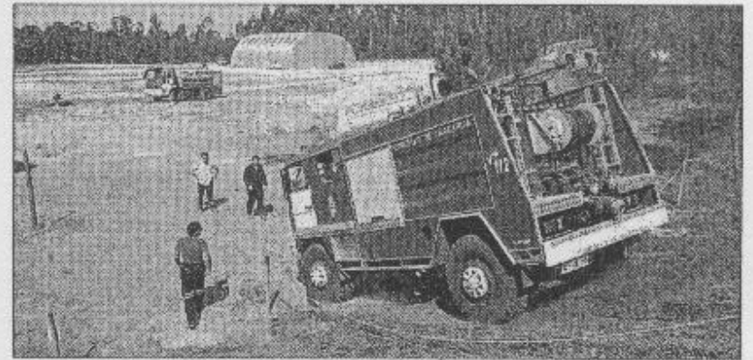
Vista de una clase práctica del curso de motobombas.