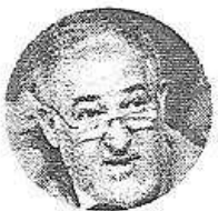
Conde-Pumpido FISCAL GENERAL DEL ESTADO

“Las medidas de seguridad no deben afectar a la dignidad de los ciudadanos”